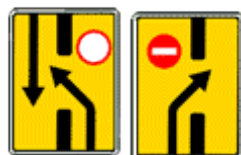
6.19.1, 6.19.2 "Предварительный указатель перестроения на другую проезжую часть".

Направление объезда участка дороги, временно закрытого для движения.