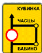
6.17 "Схема объезда". Маршрут объезда участка дороги, временно закрытого для движения.

Место остановки транспортных средств при запрещающем сигнале светофора (регулирущика).